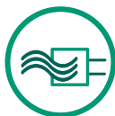
pcim Asia 青年工程师奖