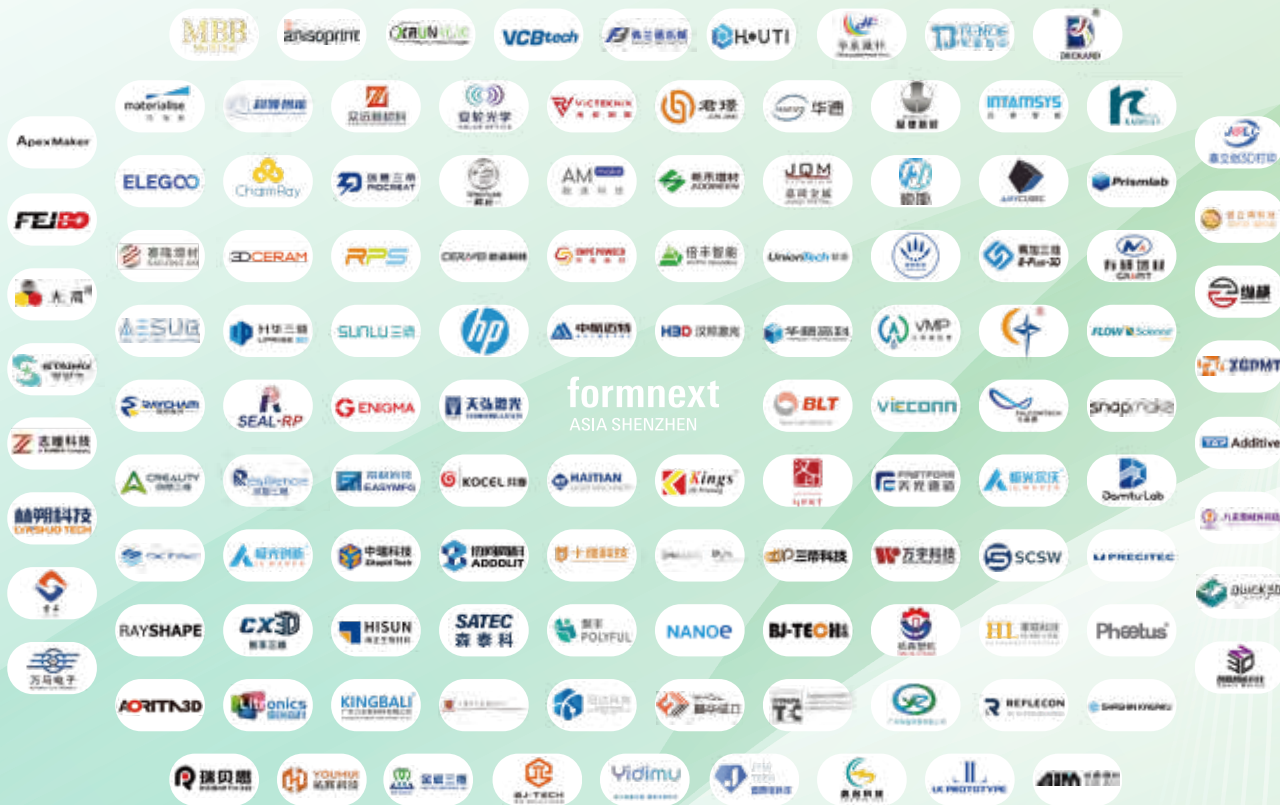
(部分名单，排名不分先后)